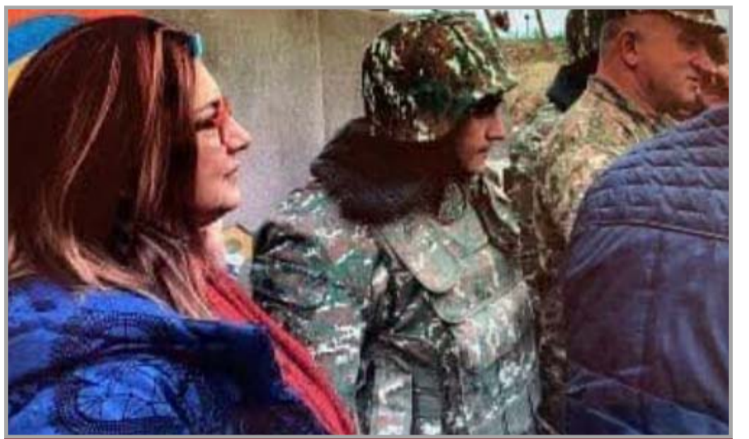
Դէպի սահմանագիծ - հայ բանակայիններու առաջնորդութեամբ

Եւ այդպիսով կազմաւորուած Հայոց բանակի սիրտը սկսաւ տրոփել համազգային սիրով, որուն ջերմութեամբ է որ մասնակից դարձաւ Արցախեան յաջողական պատերազմներուն, սակայն դժբախտաբար հրամանատար դիրքերու վրայ զօրավար Վ. Սարգսեանի ոգին չէր թեւածեր..., հետեւաբար վախճանը եղաւ ոչ հայավայել: