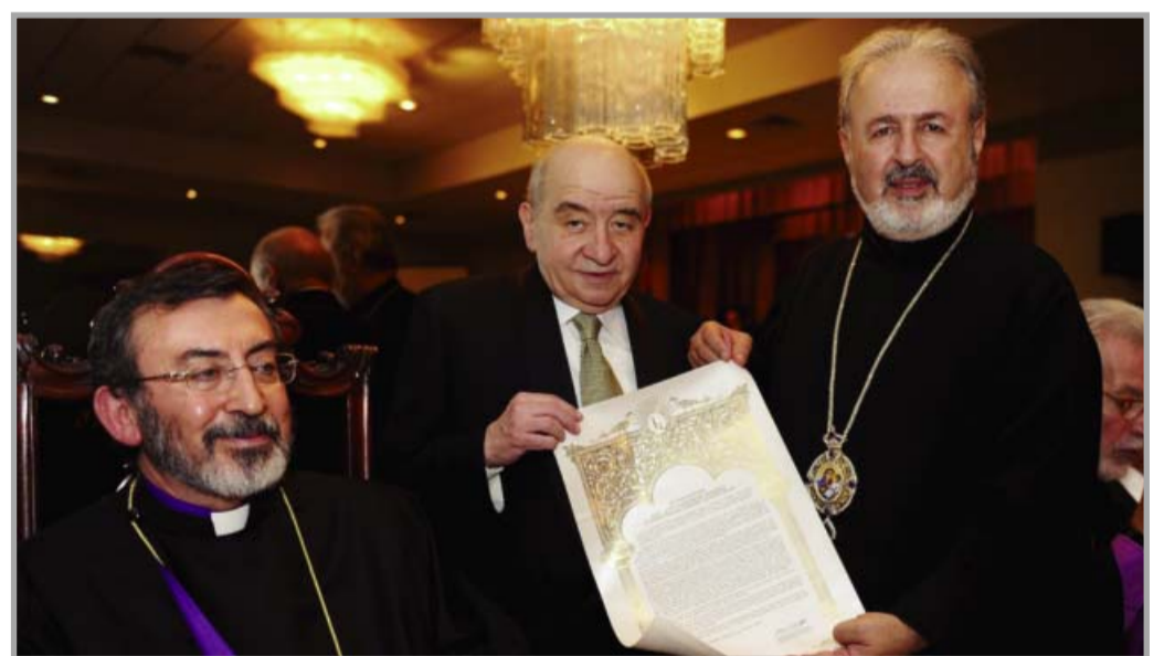
Առաջնորդ Խաճակ Արք. Պարսամեանի եւ Պոլսայ պատրիարքական փոխանորդ Արամ Արք. Աբէշեան

Վերջապէս կազմակերպեց կէս միլիոն տոլարի նուիրահաւաք՝ Վարդանանց Ասպետներու հիմնադրութեան հարկւրամեակին առթիւ ցեղասպանագէտ Դոկտ. Թաներ Արչամի, Կերկերեանի եւ Անտոնեանի արխիւներու աշխատանքին համար Գլխաւոր համալսարանէն ներս. աշխատանք մը որ տակաւին կը շարունակէ իր ծառայութիւնը բերել մեր արդար դատին: