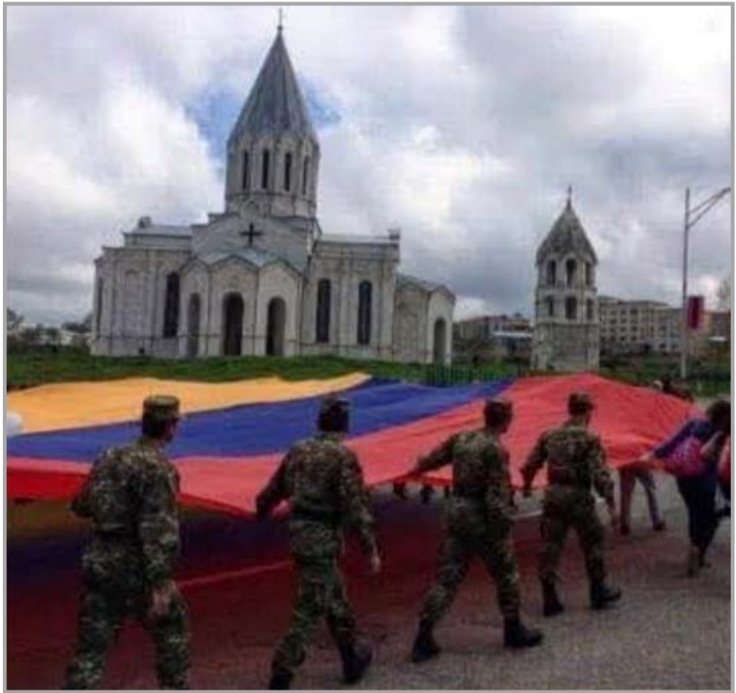
Դէպի Շուշի Ղազանչեցուց եկեղեցի

34 տարի առաջ Հայաստանի եւ Սփիւռքի համայն հայութիւնը ողջունեց մեր Հայրենիքի Գ. Անկախութեան պայծառ արշալոյսը, որուն շնորհիւ մեր Հայրենիքը հռչակուեցաւ անկախ պետութիւն: Դարերու ընթացքին իր անկախութիւնը բազմաթիւ անգամներ կորսնցուցած ժողովուրդը ի կատար ածեց իր դարատուր երազանքը՝ յանուն գալիք դարերուն եւ ամէն արշալոյսին Հայրենիքի թէ՛ Սփիւռքի տարածքին գտնուող իւրաքանչիւր հայորդի հպարտօրէն երգեց մեր ազգային հիմնը, թէկուզ ան հիմնուած ըլլայ «խաղաղի աղջկայ երգը» բանաստեղծութեան վրայ: