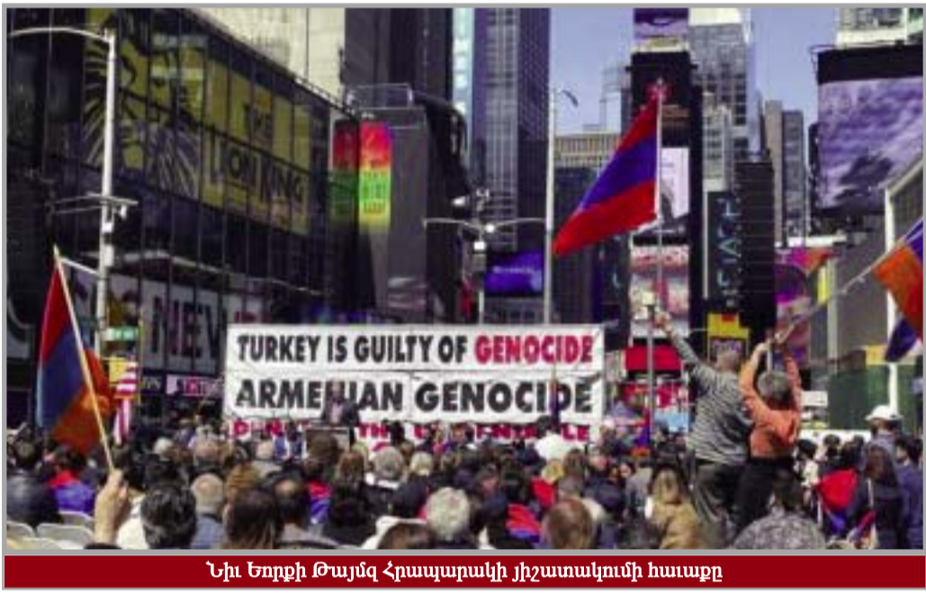
Նիւ Եորքի Թայմզ Հրապարակի յիշատակումի հաւաքը

Ամիսներու կազմակերպական աշխատանք պահանջող այդ եզակի հաւաքը կրցաւ ի մի հաւաքել նաեւ գաղութին զանազան կազմակերպութիւնները: Երկար շրջան մը ազգային քաղաքական կազմակերպութեան մը ենթակայ